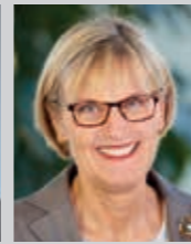
Dorothea Störr-Ritter Landrätin Breisgau- Hochschwarzwald